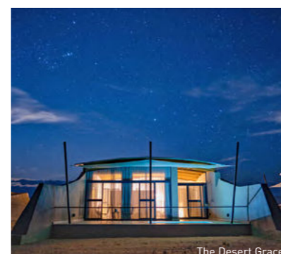
The Desert Grace