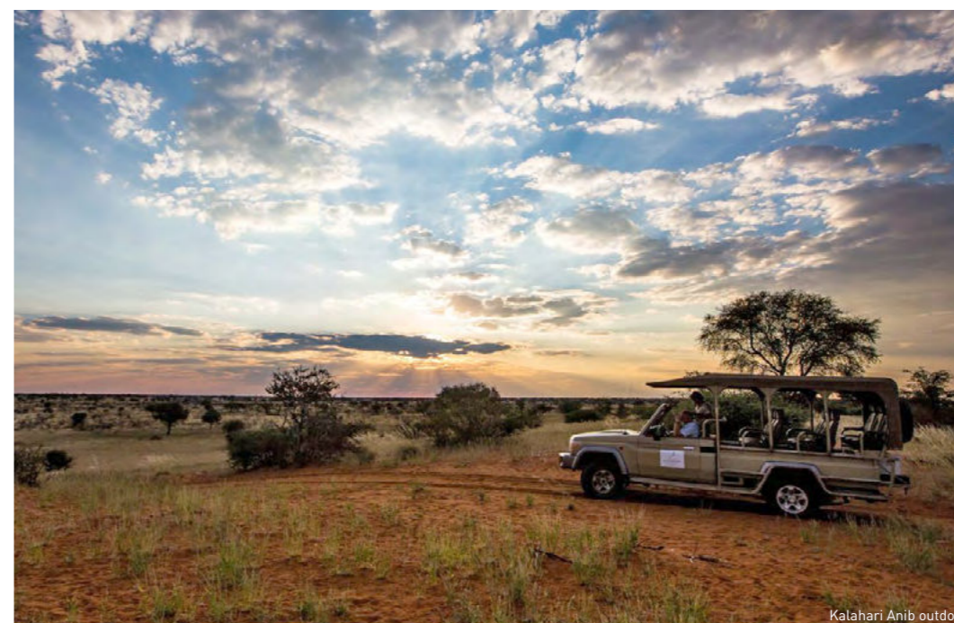
Kalahari Anib outdoor